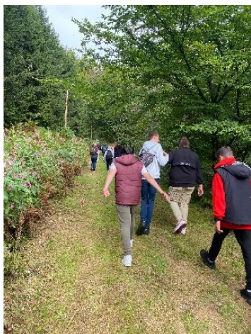
Wanderung zu Metabolon und Parcours Klasse 9