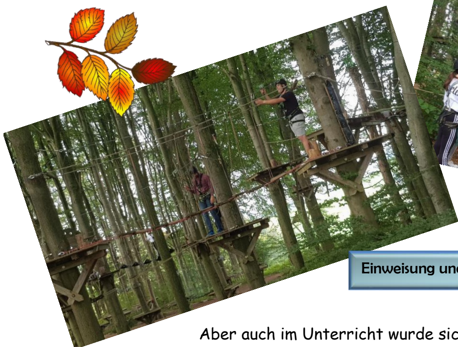
Einweisung und Klettern der Klasse 10