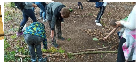
Sportmuseum, Jonglieren und Waldspaziergang Klasse 6a